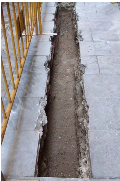
Fotografia núm. 3: vista de la rasa 100