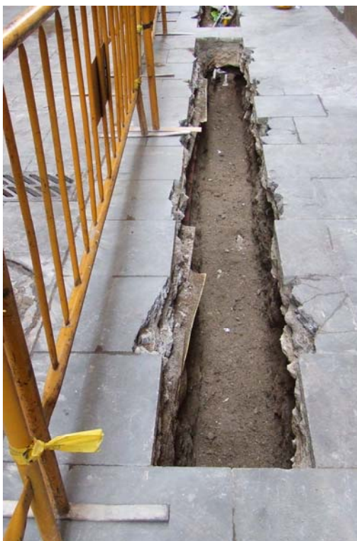
Fotografia núm. 4: vista de la rasa 100