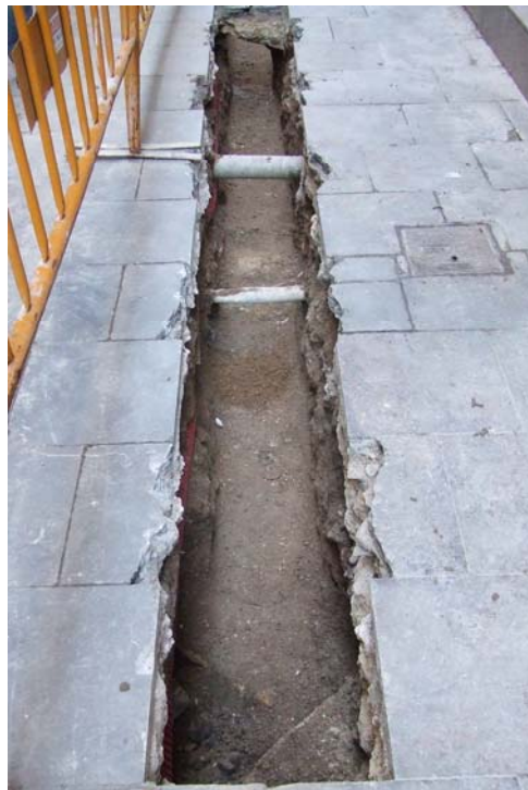
Fotografia núm. 2: Vista de la rasa 100