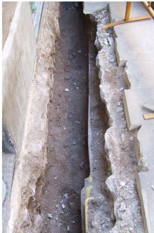
Fotografia núm. 6: Vista de la rasa 200