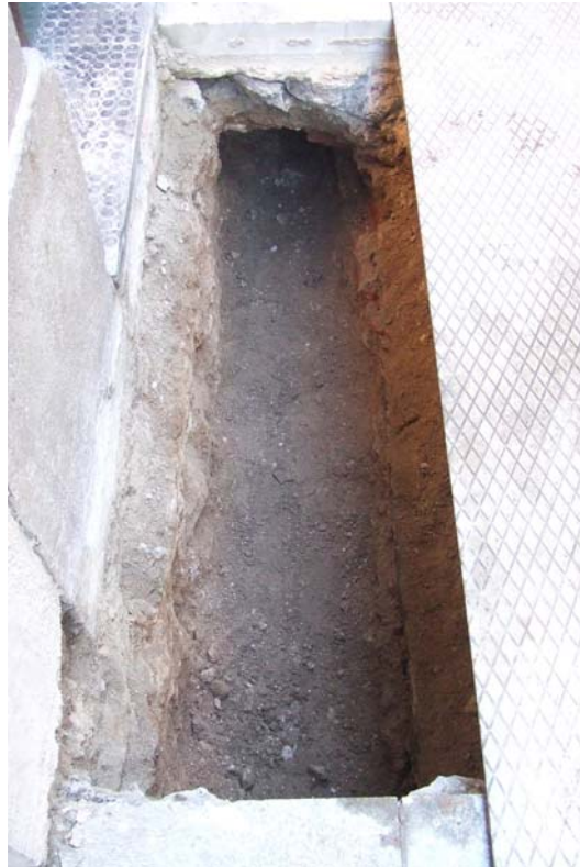
Fotografia núm. 5: vista general de la rasa 200