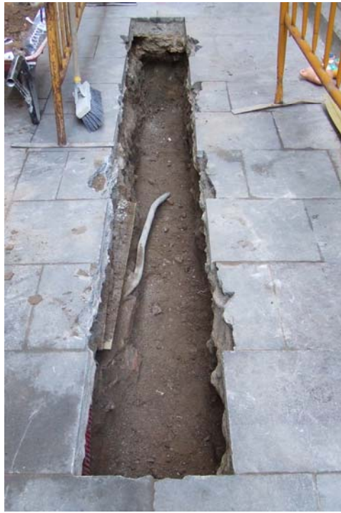
Fotografia núm. 1: Vista de la rasa 100