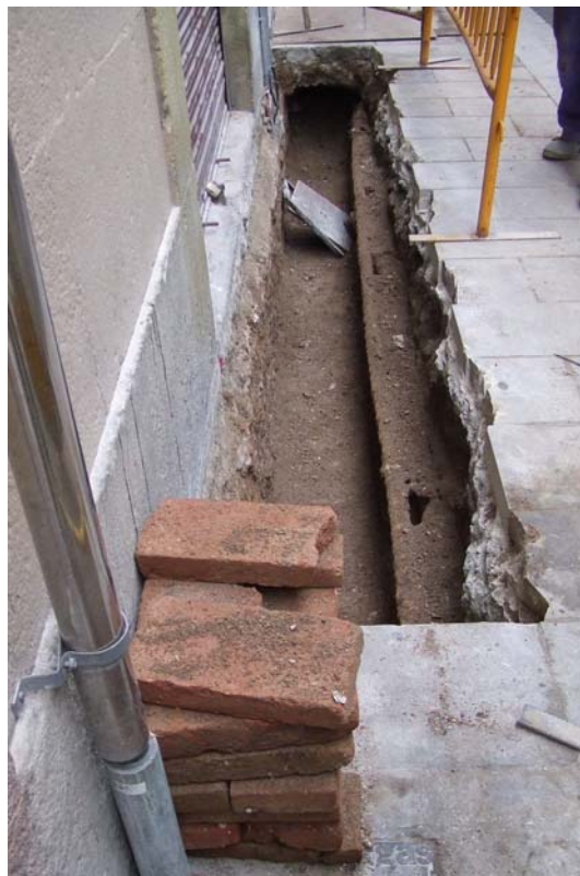
Fotografia núm. 8: Vista de la rasa 200