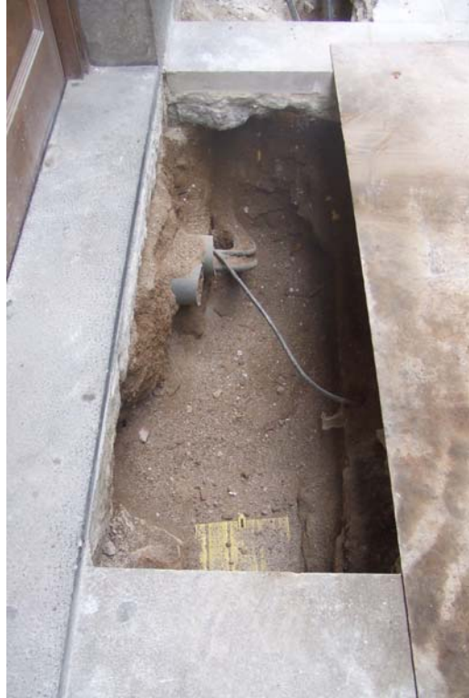
Fotografia núm. 7: Vista de la rasa 200